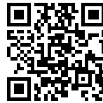
PLANCHE DE DECOUPE DOUBLE HDPE